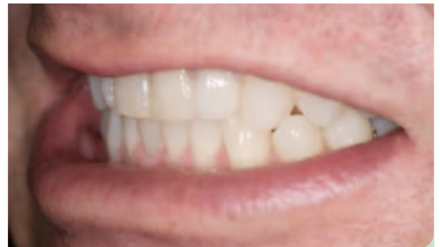
Abb. 19: Lächeln Schlussbiss.

Literaturliste unter www.zmk-aktuell.de/literaturlisten