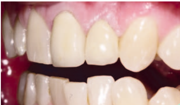
Abb. 11: Ausgangssituation Seitenansicht.