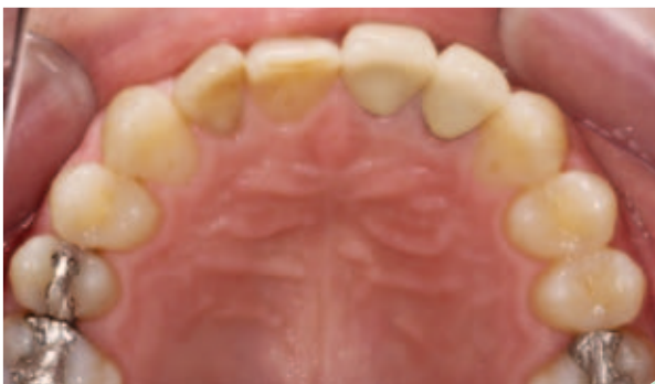
Abb. 13: Ausgangssituation Oberkiefer Okklusalansicht.