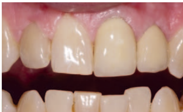
Abb. 2: Ansicht vor der Behandlung.

Alternativen | Mit dem Patienten wurden Alternativen besprochen. Eine feste Klammer kam aus Kostengründen nicht infrage. Schwierigkeiten würden durch ein simultanes Bleaching aufgrund der provisorischen Kronen entstehen. Die posteriore Okklusion des Patienten war gut. Auch eine vollständige Versorgung der Front durch Veneers wurde diskutiert. Nachdem der Patient realisiert hatte, wie einfach und schnell eine Begradigung der Zähne durchgeführt werden kann, erschien dies keine adäquate Lösung vor dem Hintergrund eines minimalinvasiven Denkansatzes.