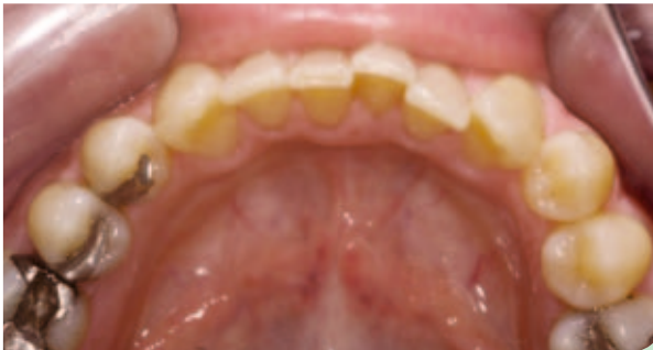
Abb. 15: Ausgangssituation Unterkiefer Okklusalansicht.

Fazit | In jeder Praxis gibt es eine Vielzahl von Patienten, die ähnliche Beschwerden und Wünsche haben wie in diesem oben genannten Fallbeispiel. Für die meisten Patienten ist eine Behandlung mit Veneers schlicht nicht vorstell- oder finanzierbar; dank schneller und kostengünstig präprothetischer Zahnkorrektur hingegen schon. Die Möglichkeit, den Aligner mit Bleaching zu kombinieren, ist ein wesentlicher Vorteil, um die Compliance des Patienten hochzuhalten und um ein noch schöneres Ergebnis zu erzielen. Natürlich ist die Fallselektion absolut essenziell. Es ist und bleibt immer unerlässlich, abzuwägen, was durch den Zahnarzt behandelbar ist und welcher Patient zu einem Facharzt für Kieferorthopädie überwiesen werden muss.