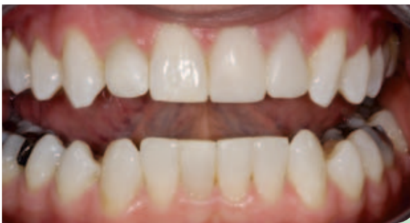
Abb. 9: Mit Provisorien.