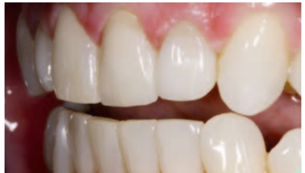
Abb. 12: Abschlussituation Seitenansicht.