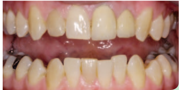
Abb. 8: Ausgangssituation.

Eine Woche später, und zwei Wochen nach Beendigung des Bleachings, wurde der Patient zur Besprechung der Farb- und Formbestimmung einbestellt. Weitere zwei Wochen später wurde der laborgefertigte Drahtretainer von 33 nach 43 angebracht [12–15]. Die temporären Kronen wurden entfernt und die neuen IPS e.max HT-Kronen (Ivoclar Vivadent) mit Variolink II (Ivoclar Vivadent) und Optibond FL (Kerr) eingliedert. Der Patient war mit dem Ergebnis sehr zufrieden und empfand das Aussehen seiner Zähne als sehr natürlich (Abb. 8–14).