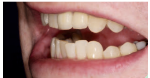
Abb. 17: Ein Lächeln in der Ausgangssituation.