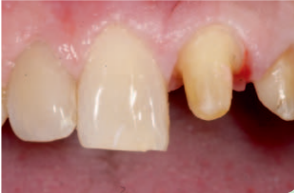
Abb. 3: Situation nach Entfernung der Kronen.