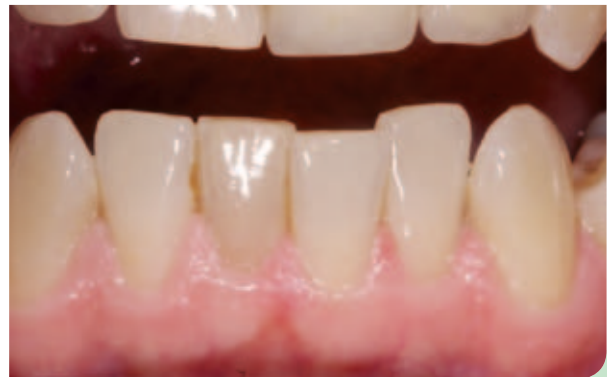
Abb. 6: Unterkiefer vor der Behandlung.

tragen und nur zum Essen und für Pausen herauszunehmen. 20 Stunden täglich ist die maximal erforderlich Tragezeit, denn diese intermittierende Anwendung reduziert das Risiko von Wurzelresorption [10,11]. Bei der Kontrolle nach zwei Wochen war deutlich zu erkennen, dass die Kontakte fest geschlossen waren und die Zähne sich etwas bewegt hatten. Im OK und UK wurden weitere IPR durchgeführt. Die okklusalen Kontakte der provisorischen Kronen wurden angepasst, um damit Freiraum für die Bewegung der unteren Schneidezähne zu schaffen, im Besonderen für die Labialbewegung von 32. Die Abbildungen 6 und 7 zeigen, dass sich die Zähne schnell und sehr schön ausgerichtet hatten. Das Bleaching konnte also starten. Erneut wurden Abdrücke genommen, obwohl noch ca. 25 % der Stellungskorrektur fehlten. Weiche, speicheldichte Bleachingschienen wurden angefertigt und der Patient über die Anwendung informiert. Während der Inman-Aligner-Behandlung sind die Patienten schnell für Bleachingschienen zu begeistern. Es wurde Day-White von Philips Oral Healthcare verwendet, damit der Patient die Schienen nur 35 bis 45 Minuten täglich anzuwenden brauchte. Nach drei Wochen kam der Patient zur Kontrolle und war mit dem erreichten Grad der Aufhellung sehr zufrieden. Die Regulierung der Ober- und Unterkiefer-