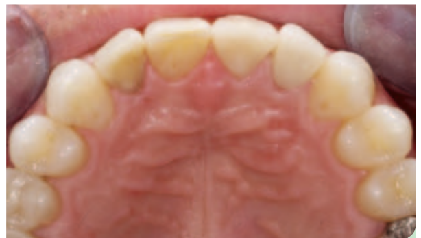
Abb. 14: Abschlussituation Oberkiefer Okklusalansicht.

Herstellerangaben zu den verwendeten Produkten sind im Beitrag integriert.