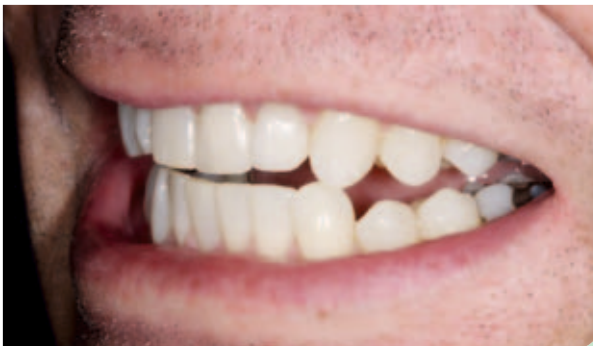
Abb. 18: Ein Lächeln zum Abschluss.