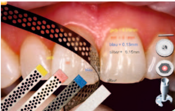
Abb. 5: Anatomisch respektvoll stripfen mit den IPR Strips (Komet Dental, Lemgo).