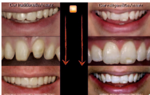
Abb. 1a: Die unterschiedlichen Behandlungsprocedere.

Viele Patienten bevorzugen eine herausnehmbare Lösung allein schon deshalb, weil sie sich flexibler in ihre Lebensführung integriert. Für schnelle, nichtinvasive und ausge-