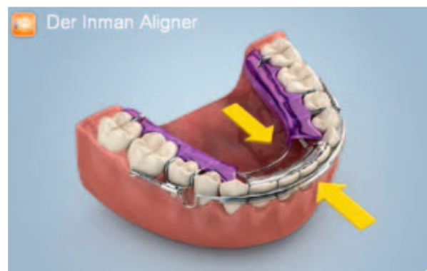
Abb. 1b: Inman Aligner.

Herstellerangaben zu den verwendeten Produkten sind im Beitrag integriert.