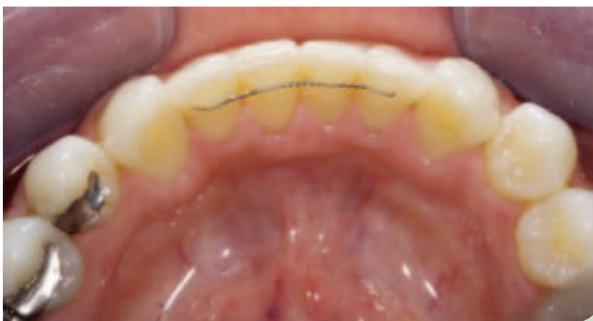
Abb. 16: Abschlussituation Unterkiefer Okklusalansicht.