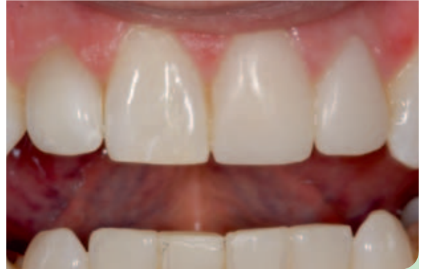
Abb. 4: Provisorische Kronen sind eingegliedert.