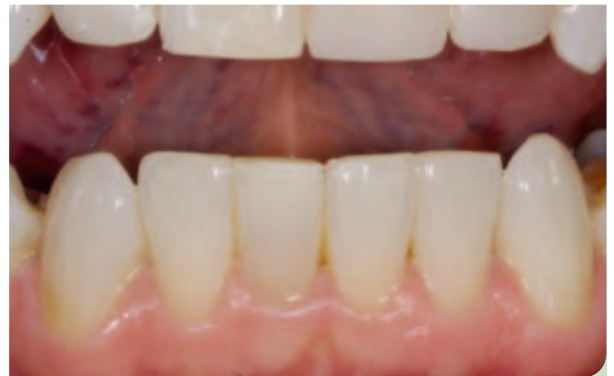
Abb. 7: Situation des Unterkiefers nach 7 Wochen.

tragen und nur zum Essen und für Pausen herauszunehmen. 20 Stunden täglich ist die maximal erforderlich Tragezeit, denn diese intermittierende Anwendung reduziert das Risiko von Wurzelresorption [10,11]. Bei der Kontrolle nach zwei Wochen war deutlich zu erkennen, dass die Kontakte fest geschlossen waren und die Zähne sich etwas bewegt hatten. Im OK und UK wurden weitere IPR durchgeführt. Die okklusalen Kontakte der provisorischen Kronen wurden angepasst, um damit Freiraum für die Bewegung der unteren Schneidezähne zu schaffen, im Besonderen für die Labialbewegung von 32. Die Abbildungen 6 und 7 zeigen, dass sich die Zähne schnell und sehr schön ausgerichtet hatten. Das Bleaching konnte also starten. Erneut wurden Abdrücke genommen, obwohl noch ca. 25 % der Stellungskorrektur fehlten. Weiche, speicheldichte Bleachingschienen wurden angefertigt und der Patient über die Anwendung informiert. Während der Inman-Aligner-Behandlung sind die Patienten schnell für Bleachingschienen zu begeistern. Es wurde Day-White von Philips Oral Healthcare verwendet, damit der Patient die Schienen nur 35 bis 45 Minuten täglich anzuwenden brauchte. Nach drei Wochen kam der Patient zur Kontrolle und war mit dem erreichten Grad der Aufhellung sehr zufrieden. Die Regulierung der Ober- und Unterkiefer-