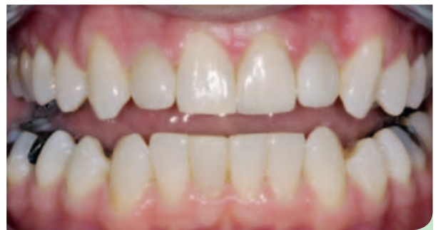
Abb. 10: Mit e.max-Kronen.